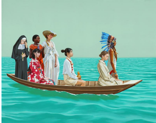
他们, 乘风破浪的姐姐, 布面丙烯 120x150cm, 2020

唐征维、沙爽，以及两位新艺术家何海峰、杜英奇的作品为我们观察“新常态”增添了崭新的视角。唐征维的剪纸创作展示了一个人痛苦而复杂的内心之旅，试图构想一个精神自我，以达到远离尘世的终极自由。沙爽的数码画作装裱在灯箱中，在脱离了传统和经验的背景下反思“标准”和“模型”的概念。无独有偶，何海峰也从另一个视角探讨了所谓“标准”的概念，他以水墨的笔触揭示了现代混凝土景观在城市环境中毫无灵魂的现实，而这一现实在病毒大流行期间尤其明显。杜英奇的小雕塑系列通过将塑料手套、口罩等一次性使用的物品包裹上黄金，来讽刺生活的荒谬和不可预测性，纪念人类历史上这次当最唾手可得的的东西突然获得了非凡的价值，成为了决定人们生存的关键的时刻。